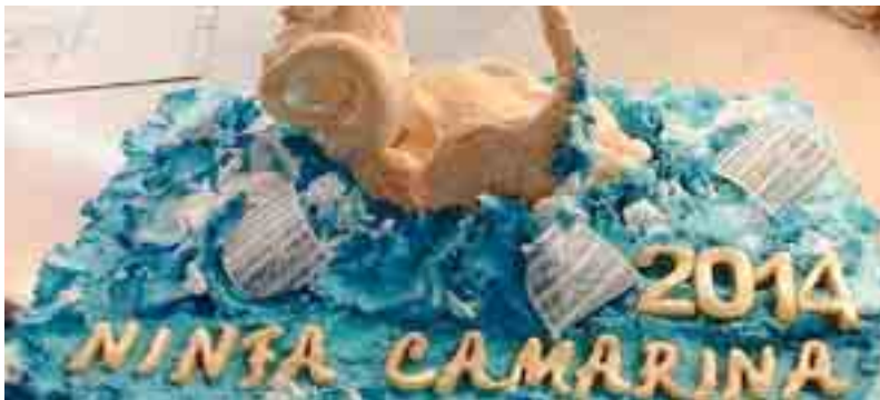
L'IMMAGINE SIMBOLO DEL PREMIO NINFA CAMARINA